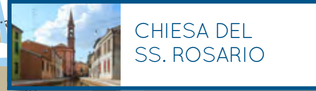
CHIESA DEL SS. ROSARIO