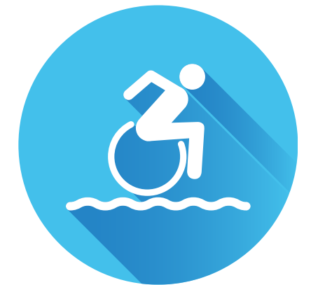
Carrozzina da spiaggia