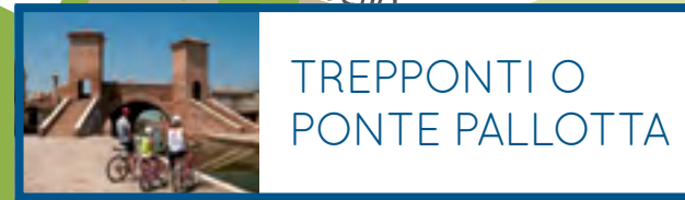
TREPPONTI O PONTE PALLOTTA