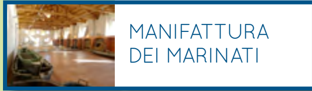
MANIFATTURA DEI MARINATI