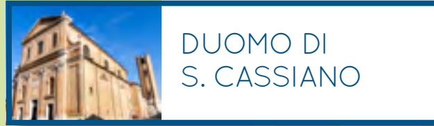
DUOMO DI S. CASSIANO