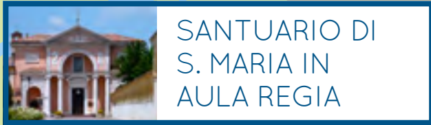
SANTUARIO DI S. MARIA IN AULA REGIA