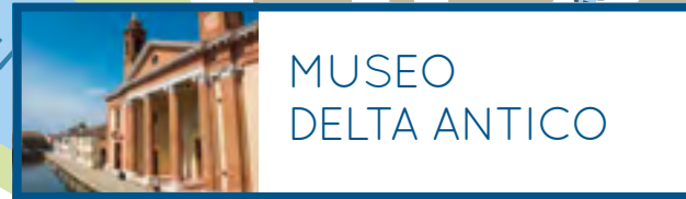
MUSEO DELTA ANTICO