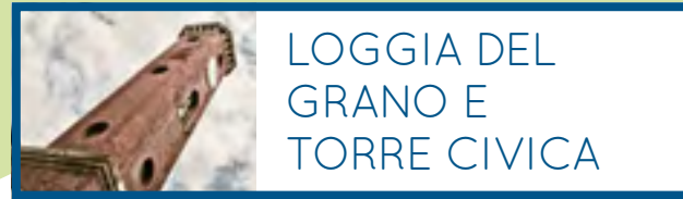
LOGGIA DEL GRANO E TORRE CIVICA