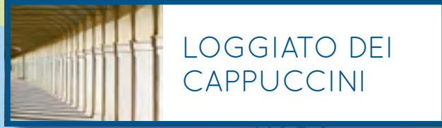
LOGGIATO DEI CAPPUCCINI